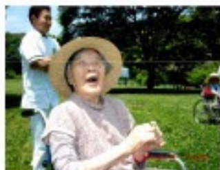
新緑散歩 (北八朔公園)