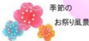
季節のお祭り風景