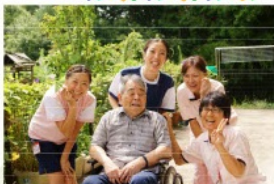
「慈愛と共生」ともに笑顔のある暮らし