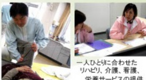
一人ひとりに合わせたリハビリ、介護、看護、栄養サービスの提供